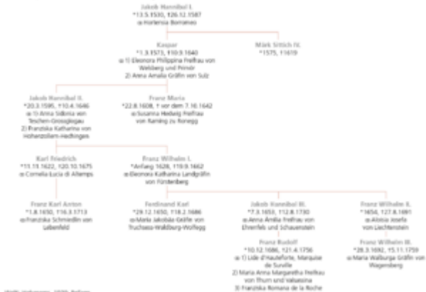
Welt: Hohenems, 1930, Beilage.