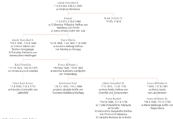
Welt: Hohenems, 1930, Beilage.