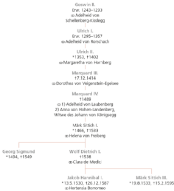
Welt: Hohenems, 1930, Beilage.