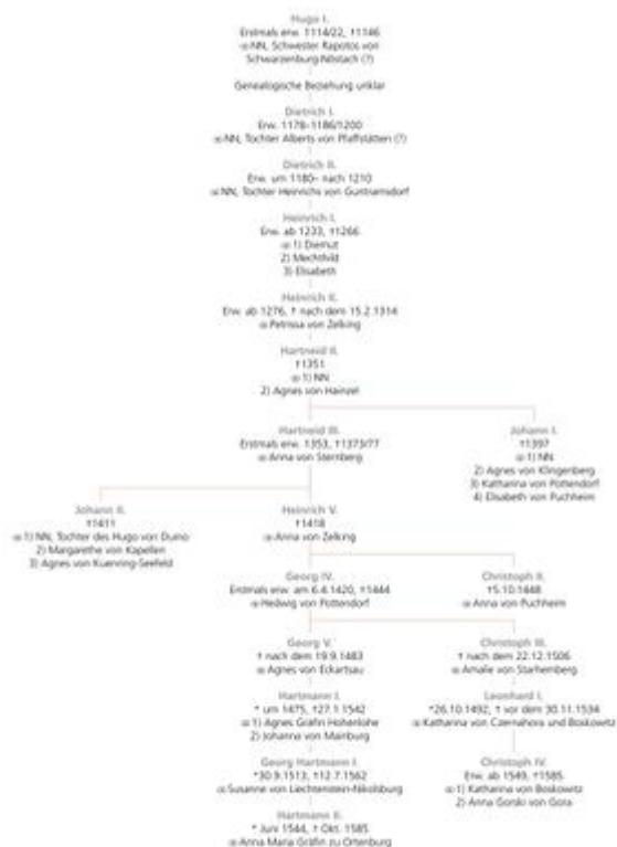
G. Wilhelm: Stammtafel des Fürst. Hauses von und zu Liechtenstein, o.J., H. Dopsch: Liechtenstein - Herkunft und Aufstieg eines Fürstentums, in: Raubholz 2, 1999, 7-87.

Auswahl (erstellt von Heinz Dopsch, Seekirchen, Kartografie: Andreas Bachmayr, Uttendorf). Die Besitzungen auf den Gebieten der heutigen Tschechischen bzw. Slowakischen Republik wurden teils nach dem Ersten Weltkrieg, teils aufgrund der Beneš-Dekrete nach dem Zweiten Weltkrieg enteignet.