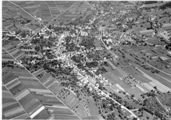
Schaan, Luftaufnahme, 1946 (LI LA). Foto: Foto Gross, St. Gallen.