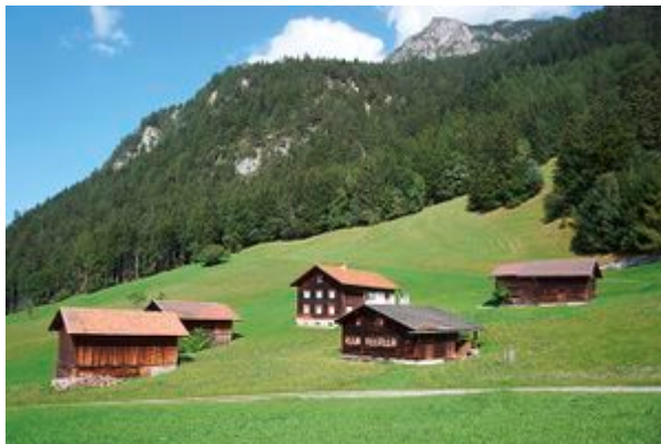
Hinder Prufatscheng ist eine alte Walersiedlung, die ihren Charakter bis heute bewahrt hat. Der Weiler war bis 1958 bewohnt. Das markante Haus im Vordergrund ist heute im Besitz der Gemeinde Triesenberg und dient als Aussenstelle des Walsermuseums.