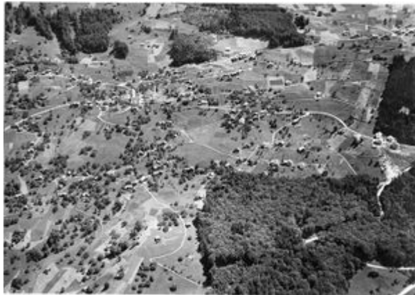
Triesenberg. Luftaufnahme, 1946 (GATb). © Foto Gross, St. Gallen. Die Streusiedlung der Gemeinde Triesenberg ist noch gut erkennbar.